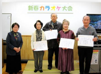
心のコもった歌声でした