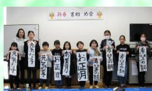
皆さん上手に書き上げました